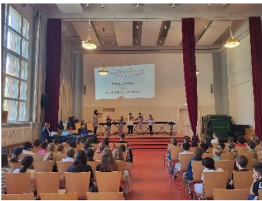
Jahrgangsfeier am 5. Juli