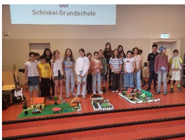
Jahrgangsfeier am 5. Juli

Inzwischen gibt es neue Fahrrad- und Rollerstellplätze an der Schule. Diese wurden sofort gut aufgenommen und werden intensiv genutzt.