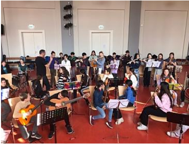
Probe für das Konzert der musikbetonten Grundschulen

In diesem Schuljahr finden die beiden Konzerte des zweiten Halbjahres entzerrt statt. Das Konzert der musikbetonten Grundschulen Berlins fand am 30. April im Kammermusiksaal der Philharmonie statt. Drei Stücke wurden nach langer und intensiver Probe von 45 unserer Schüler*innen mit großem Applaus vorgetragen.